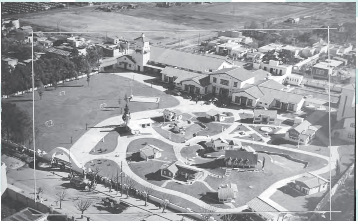
Ciudad Infantil Amanda Allen (Archivo General de la Nación. Departamento de Documentos Fotográficos).

La indagación de las dimensiones materiales y simbólicas se realizó por una doble vía. Por un lado, se apeló al análisis de documentos (fuentes primarias y secundarias) y simultáneamente, se realizaron entrevistas a informantes calificados. El corpus documental estuvo con-