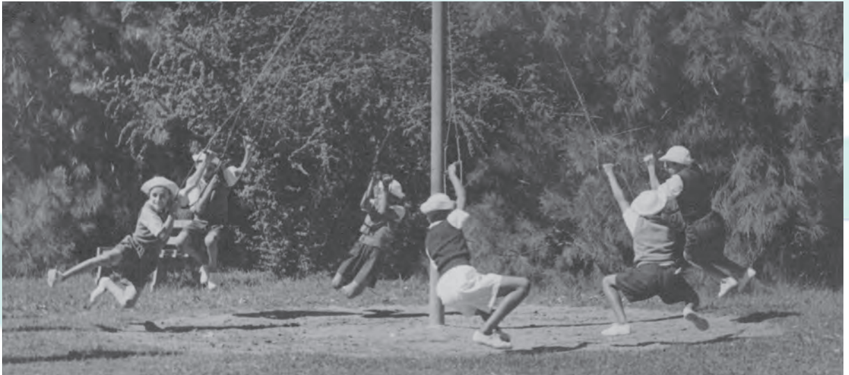
Niños en la colonia de vacaciones; obra que realiza la Fundación de Ayuda Social. María Eva Duarte de Perón. Año 1948. Ciudad Estudiantil Juan Perón.