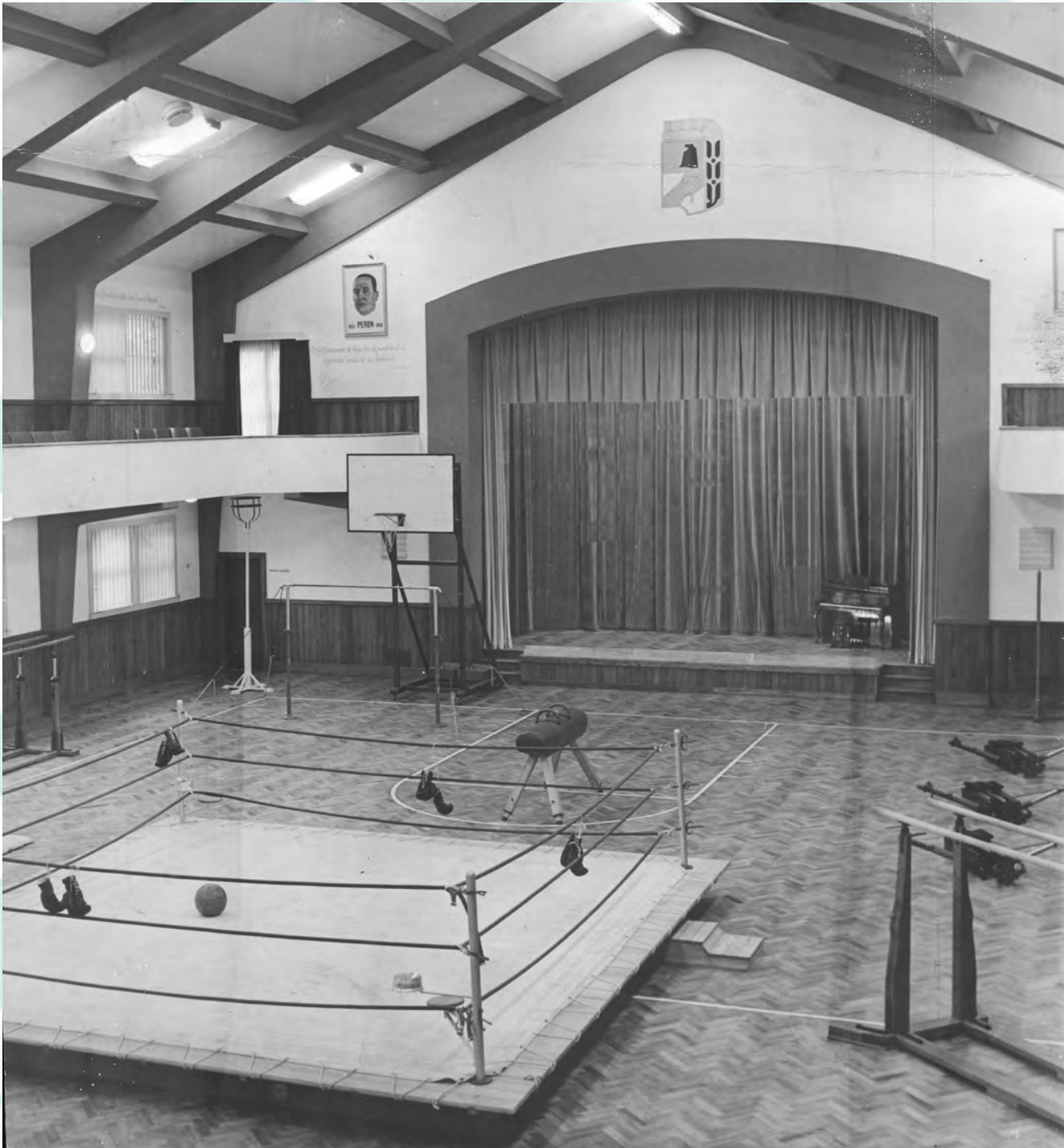
Salón de Deportes de la Ciudad Estudiantil Juan Perón.

Con referencia al financiamiento destinado a la implementación de políticas en el sector, convergieron las distintas fuentes. En 1949 el gobierno nacional acordó una contribución de 950.000$ a la Fundación para la organización del Campeonato Argentino de Fútbol Infantil; uno de 1.500.000$ en 1950; de 3.500.000$ en 1951 – en el que se especifica el destino: realizar campeonatos de fútbol y básquetbol infantil en todo el país, y en el gran Buenos Aires de natación y atletismo, además de efectuarse la donación de terrenos a dicha entidad. El subsidio ascendió a 3.000.000$ en los años 1952, 1953 y 1954 para la organización de los Campeonatos Infantiles Evita y Juveniles Juan Perón (Aguirre; 2007). Pero la mayor fuente de ingresos provenía de las donaciones realizadas por sindicatos, agrupaciones, empresas, organismos estatales, y también individuos, tal como se puede observar en las memorias de la