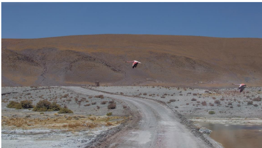
Figura 6. Tumba del Hombre Muerto, sitio sagrado en un camino ancestral y comunitario, hoy usado por vehículos mineros, Salar del Hombre Muerto.