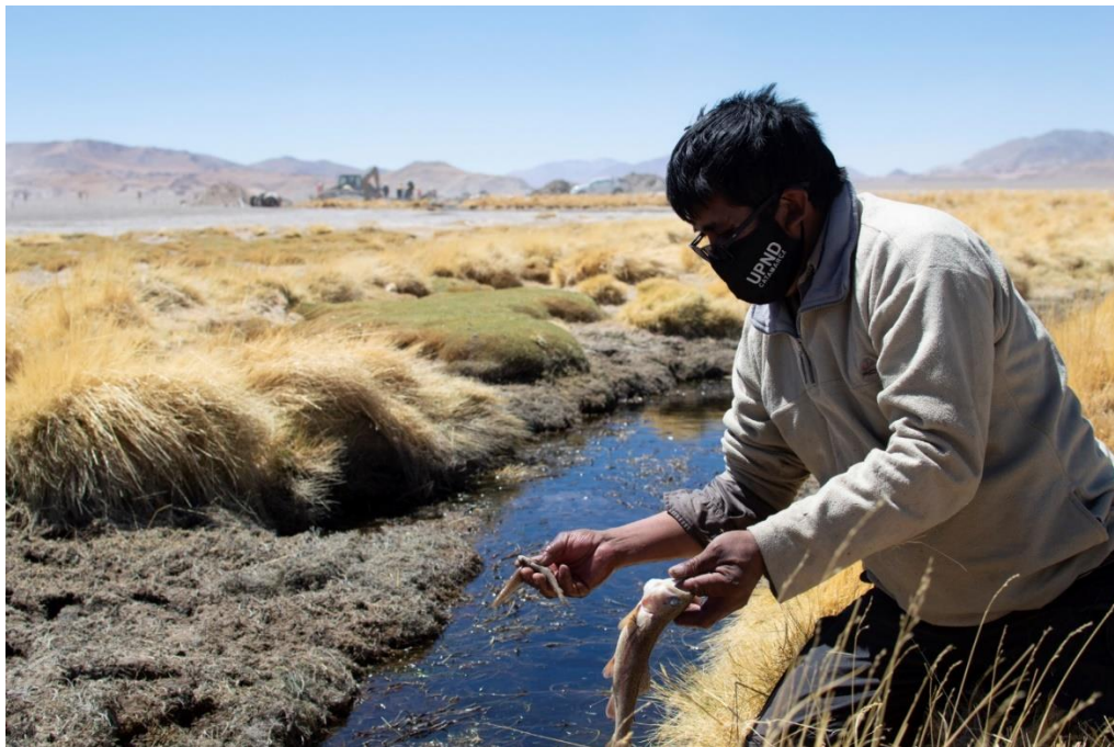
Figura 4. Mortandad de peces en el río Los Patos, Salar del Hombre Muerto.

Débora Cerutti / Cartografía del daño en el altiplano andino en torno a la minería... 187 / 220