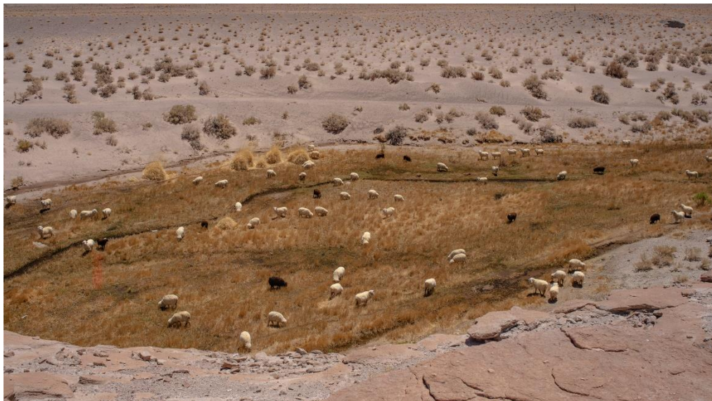
Figura 3. Antofagasta de la sierra.

Débora Cerutti / Cartografía del daño en el altiplano andino en torno a la minería... 187 / 220