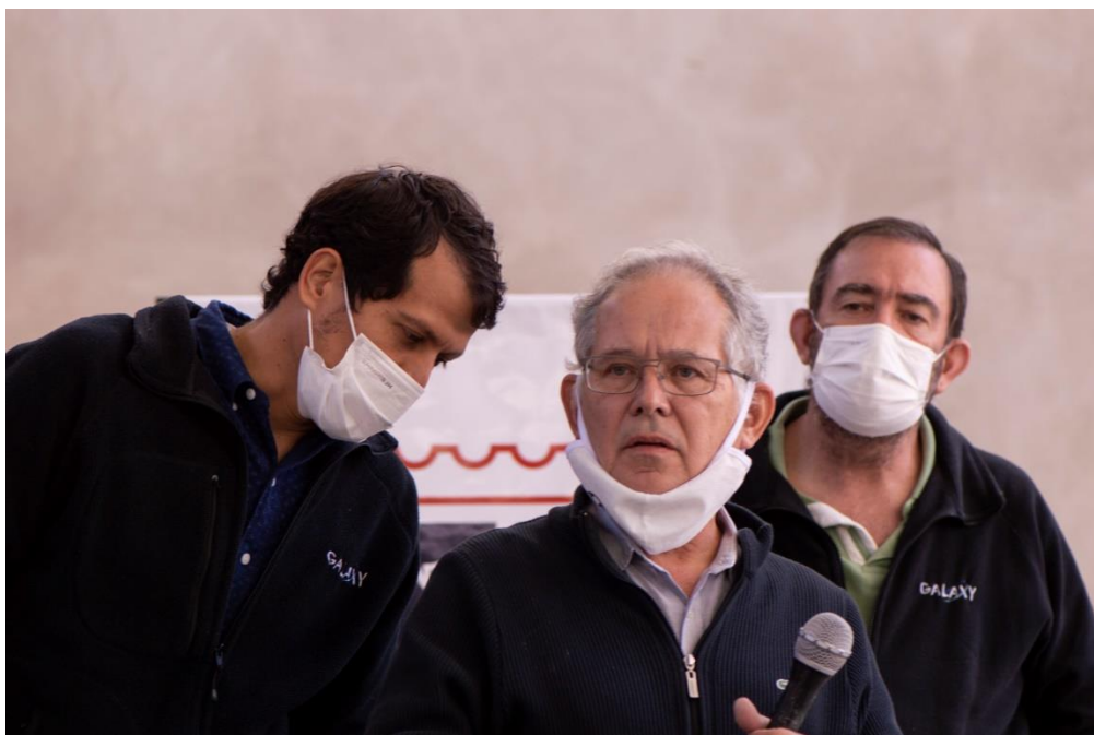
Figura 8. Primera charla técnica participativa convocada por Galaxy, Antofagasta de la Sierra. Fotografía tomada por Cerutti y Bensadon, 2021.

Las sublimaciones que se realizaron en color gris y que constelamos en esta serie son cuatro: censura e intervención de medios; utilización de fondos públicos para la construcción de la infraestructura de uso privado; presentación tendenciosa de la información, vulneración del derecho a la información pública; desprestigio, difamación, campaña negativa sobre la comunidad.