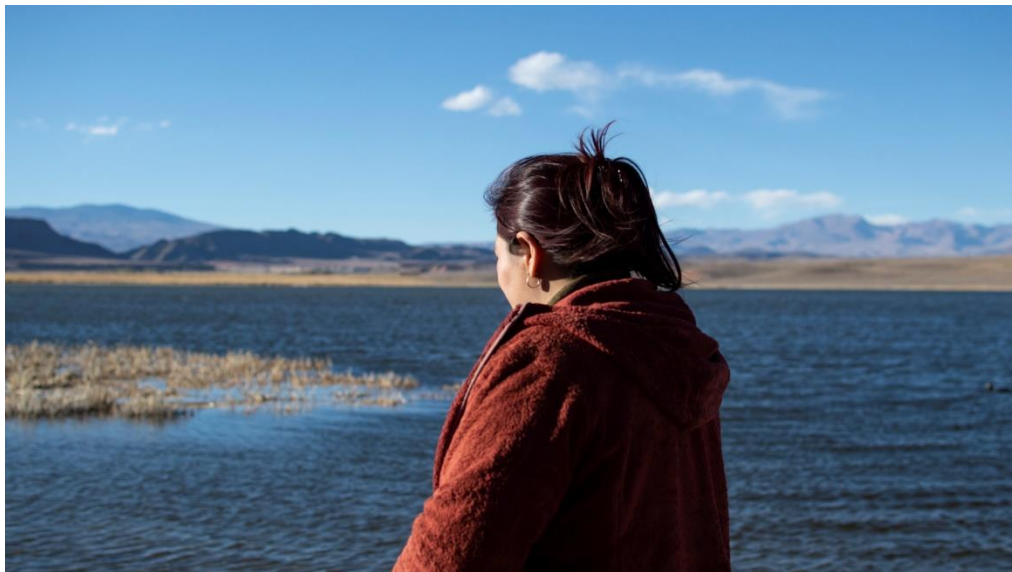
Figura 7. Miembro de comunidad Atacameños del Altiplano, con sumario administrativo por su activismo.

Débora Cerutti / Cartografía del daño en el altiplano andino en torno a la minería... 187 / 220