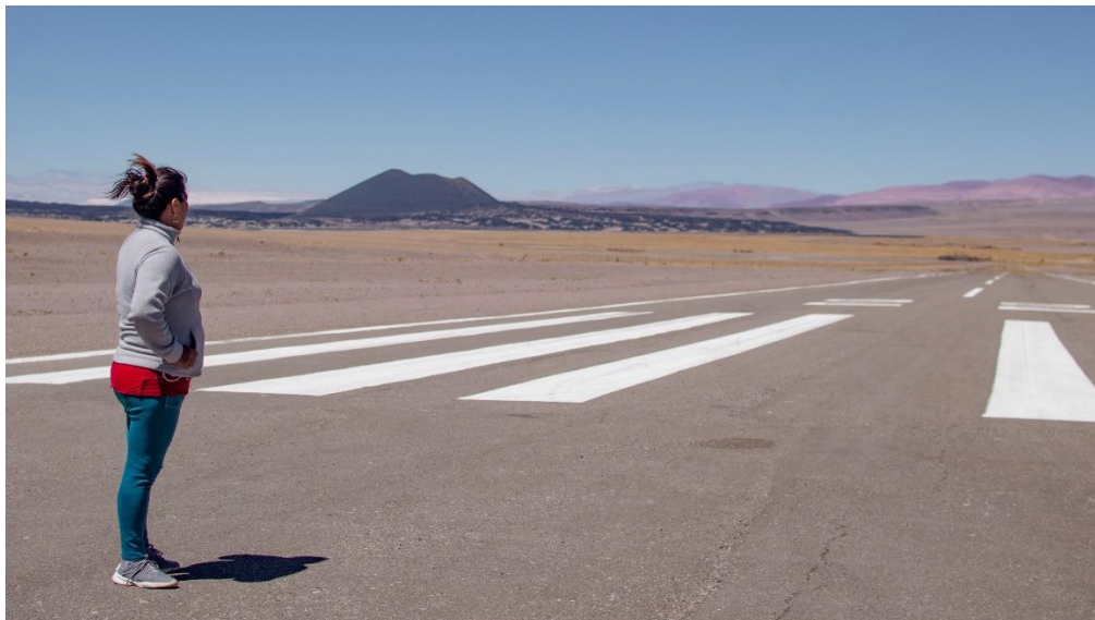
Figura 5. Pista de aterrizaje en Antofagasta de la Sierra. Fotografía tomada por Cerutti y Bensadon, 2021.

Débora Cerutti / Cartografía del daño en el altiplano andino en torno a la minería... 187 / 220