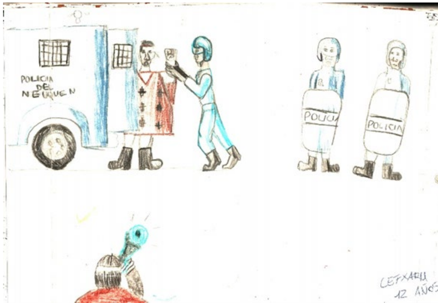
Figura 3: dibujo realizado por Lefxaru, 1998.

Melisa Cabrapan Duarte / La centralidad del género en las resistencias antiextractivistas del Consejo Zonal Xawvn Ko 9 / 39