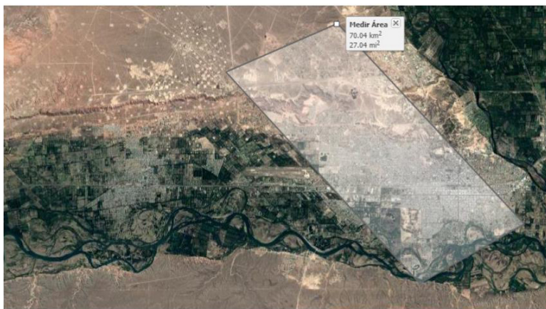
Imagen 3. Plano de mensura de los lotes 3 y 4 de la Sección 1. Plataforma Optic, 2018.