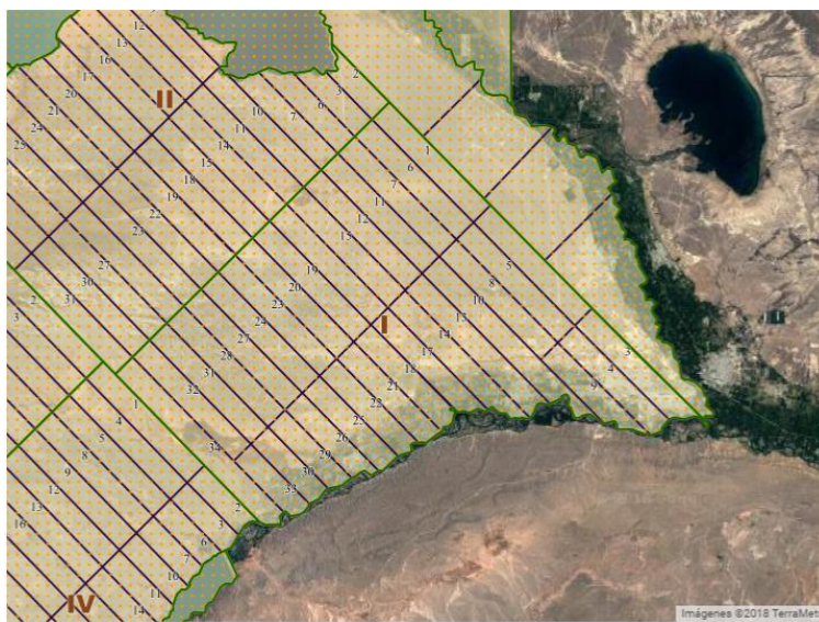
Imagen 2. Plano de la Sección 1 y los lotes que comprende (Remate público 1885). Plataforma Optic, 2018.