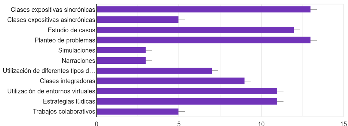
Tabla 3. Estrategias de enseñanza utilizadas por los docentes noveles encuestados en el contexto de pandemia.

En un primer análisis, podemos llegar a una aproximación, sobre las estrategias analizadas; a pesar del alto porcentaje de la modificación de las planificaciones y la adaptación de contenidos de acuerdo a las demandas y necesidades de estudiantes, en la esfera metodológica alternaron entre lo tradicional y lo innovador, utilizando clases sincrónicas y expositivas, como así también eligieron como opciones planteo de problemas, estudios de casos y estrategias lúdicas.