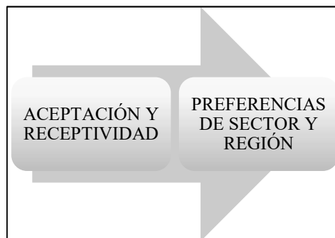
Figura 1 – Cuestionario estructurado

de la UNESP para que se convierta en normativa sin requerir la elección de los estudiantes, es necesario comprender sus opiniones para que este proyecto sea viable. A través del cuestionario estructurado, se espera identificar los siguientes dos puntos que serán cruciales para una investigación más precisa. Estos puntos están delineados en la figura 1 y explicados a continuación.