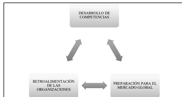
Figura 2 – Impactos en la formación