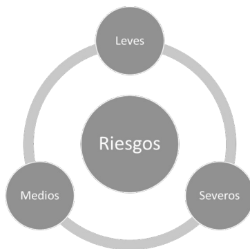
Figura 1: Niveles de Riesgo