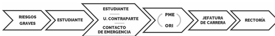
Figura 6: Gestión de riesgos severos

Por otro lado, si la información de la/el estudiante llega a través de una persona cercana, ya sea la estipulada en el Formulario de Emergencia u otra, la unidad a cargo de la movilidad del mismo será quien buscará tomar contacto con este/a a través de las distintas partes interesadas, pudiendo en última instancia, acudir a Rectoría. Esta última, como representante oficial de la Universidad, tomará contacto con las organizaciones pertinentes para resolver la situación de forma adecuada (Embajadas, Consulados, Rectorías, contrapartes, hospitales, policías, entre otras). Junto a lo anterior, también se procederá a contactar a la familia, si es que esta no ha sido contactada previamente por la unidad a cargo de la movilidad.