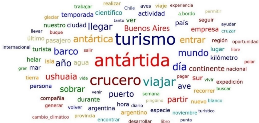
Figura 4: Frecuencia de términos sobre ‘turismo’. Fuente: elaboración propia a partir del software Atlas.ti 9