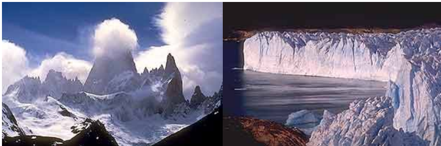
Figura 3: (derecha) Cerro Fitz Roy (Foto 2) Fuente: www.argentinaxplora.com Glaciar Perito Moreno (Foto 1) Fuente: www.argentinaxplora.com

como ajo, papa, frutilla, acelga, lechuga y achicoria. La administración pública es el sustento de buena parte de la población también en ambos asentamientos.