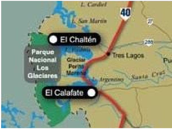
Figura 2 Área de estudio sobre la Ruta N° 40.

Los glaciares son una de las principales atracciones de Santa Cruz. El Parque Nacional Los Glaciares, al sudoeste de la provincia alberga campos de hielo que ocupan 2.600 km 2 (más de un 30 % de la superficie del Parque), avanzando sobre dos grandes espejos de agua, el lago Viedma y el lago Argentino. El más conocido de los glaciares es el Perito Moreno, que se expande sobre las aguas del Brazo Sur del Lago Argentino, con un frente de 5 km. y una altura, por sobre el nivel del lago, de entre los 70 y 60 metros. Esta pared de hielo cubre una extensión de 230 km 2 . El glaciar Upsala, ubicado sobre el Brazo Norte del mismo lago, es el de mayor tamaño, exhibe un largo de 50 km. y un ancho de casi 10 km. En el sector norte del Parque, frente al glaciar Viedma, se encuentra el imponente macizo de piedra de Fitz Roy o cerro Chaltén que se destaca por su altura de 3.375 metros y por su monumental aspecto con el entorno de los cordones montañosos circundantes. El área de hielos continentales y glaciares es un tesoro natural, declarado Patrimonio de la Humanidad por la UNESCO en 1981.