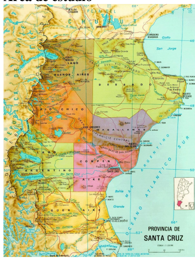
Figura 1. División Departamental de Santa Cruz.

El área de estudio se encuentra emplazada en el oeste de la provincia de Santa Cruz en el departamento Lago Argentino y son particularmente la localidad de El Calafate –puerta de entrada al Parque Nacional Los Glaciares- (Foto 1) y la Comisión de Fomento de El Chaltén emplazada al pie del cerro Fitz Roy o Chaltén (Foto 2). Estos se sitúan al oeste de la Ruta Nacional N° 40 (Figura N°2) distante más de 300 km de Río Gallegos.