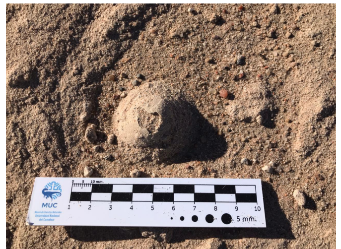
Arriba: Corte transversal de un huevo al momento de hallazgo. Abajo: Huevos in situ antes de ser retirados del campo.