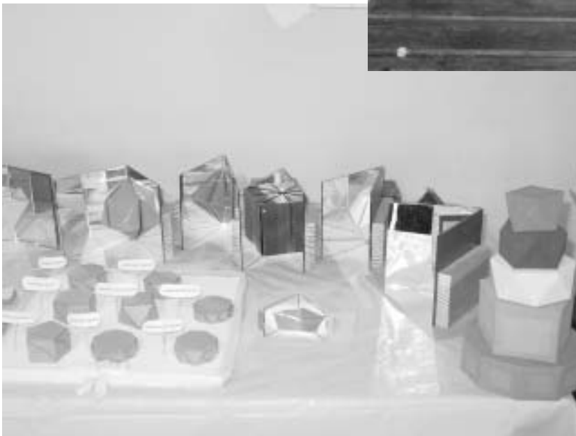
Los espejitos reproduciendo imágenes.