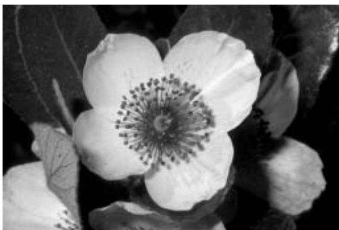
Muermo, Ulmo ( Encryphia cordifolia )