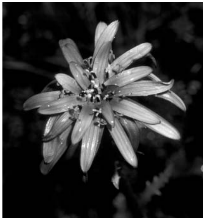
Estrella de los Andes ( Perezia pedicularidifolia )