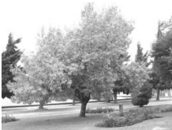
Figura 2. Los fresnos ( Fraxinus spp.) son cultivados tanto en veredas como en parques; en estos últimos pueden alcanzar pleno desarrollo, como el ejemplar fotografiado.

intranquilidad. No debe sorprendernos, por lo tanto, que quien haya presenciado o sufrido un daño personal o material por la caída de un árbol genere rechazo hacia ellos.