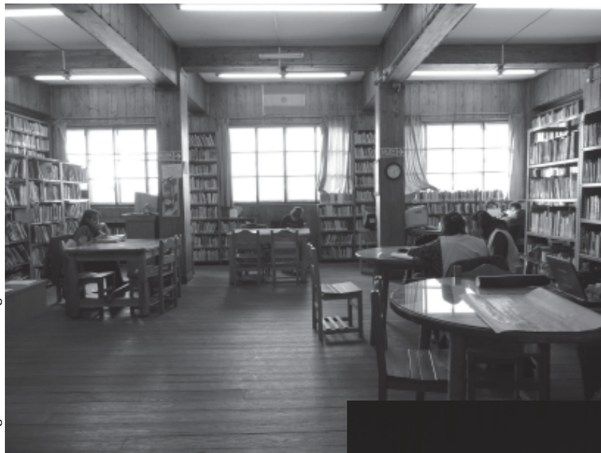
Imagen: Ma. A. Denegri.

co, y es un fuerte apoyo para alumnos y docentes de las escuelas de Bariloche. Además de las salas donde se desarrollan las actividades específicas de la biblioteca, en el primer piso se ubica un pequeño salón de actos. Este lugar ha sido el centro de numerosas manifestaciones culturales desde su inauguración. Conferencias, seminarios, exposiciones pictóricas, cursos, conciertos, teatros, recitales, funciones de cine han sido posibles gracias a la generosidad de la institución.