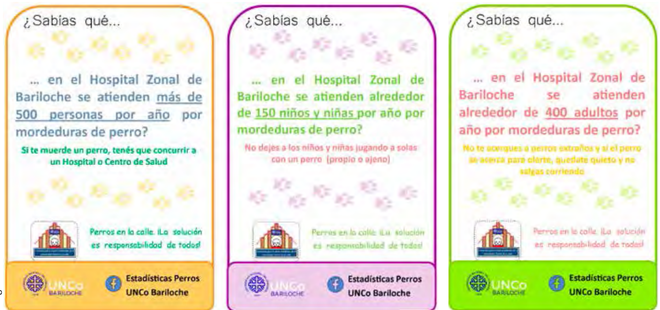
Figura 2. Carteles “¿Sabías qué...?” confeccionados a partir de los principales resultados obtenidos en el relevamiento y con recomendaciones sobre cuidado responsable y prevención de mordeduras.