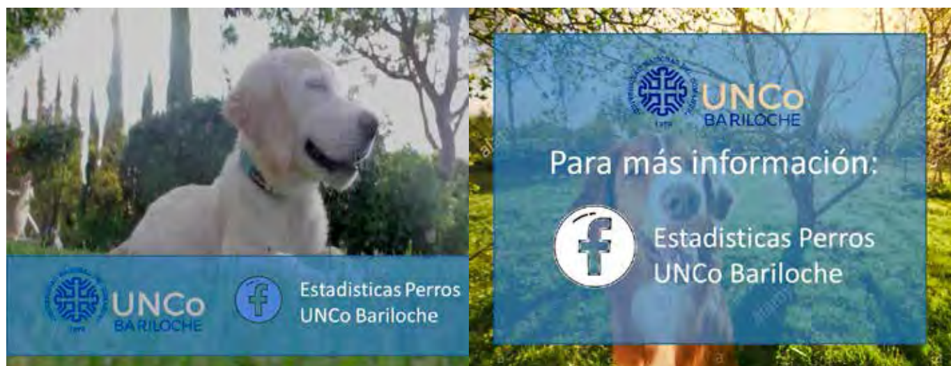
Figura 4. Portada y cierre de video sobre prevención de mordeduras de perro.

El Código Sanitario para los Animales Terrestres de 2019, elaborado por la Organización Mundial de Sanidad Animal (OIE) tiene un capítulo dedicado al control de la población de perros vagabundos. Este documento da recomendaciones precisas y adaptadas a la realidad de los países en vías de desarrollo para el control de los perros de la calle. Las medidas de control propuestas incluyen los siguientes ejes que consideramos especialmente importantes: educación y legislación sobre la tenencia responsable, control reproductivo, captura y devolución, adopción o liberación y reducción de la incidencia de mordeduras de perro.