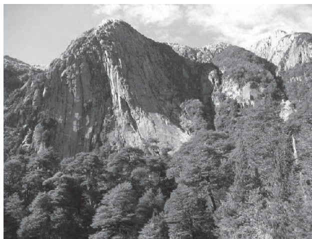
Bosque de Nothofagus en Puerto Blest