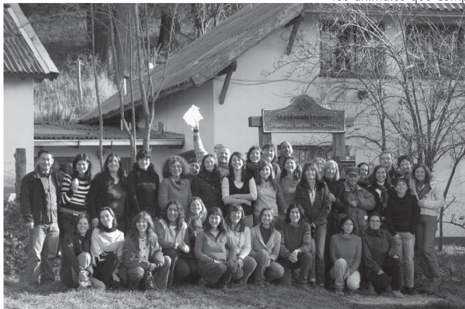
Imagen: H. F. Planas