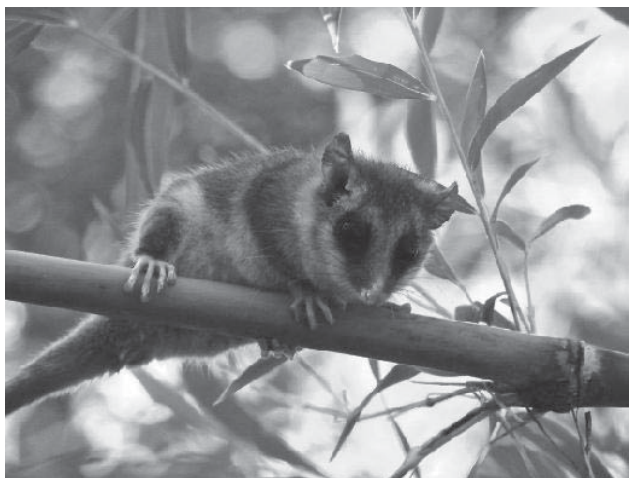
Monito de Monte