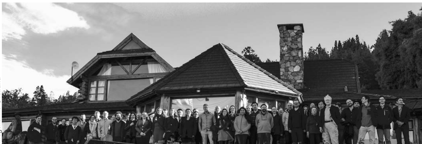
Los participantes del encuentro Distant Galaxies from the Far South , en uno de los eventos sociales del encuentro.

Aprendimos a lo largo del siglo XX que el universo no fue siempre igual: evolucionó a partir de un estado extremadamente denso y caliente, y 13.800 millones de años después todavía está expandiéndose y enfriándose. El universo joven era muy distinto del que vemos a nuestro alrededor. No había estrellas ni galaxias, sólo los elementos más simples: hidrógeno y helio, y radiación electromagnética. ¿Cómo llegó a ser como lo conocemos? ¿Cómo se formaron las primeras estrellas, las primeras galaxias? ¿Cómo eran, y cómo llegaron a ser como la Vía Láctea y el resto de las galaxias que vemos a nuestro alrededor? Preguntas como éstas reunieron en Bariloche, del 11 al 15 de diciembre de 2017, a los expertos mundiales de las "galaxias distantes". Este campo de estudio ha progresado enormemente en años muy recientes, y se espera que lo haga a paso acelerado, con la inminen-