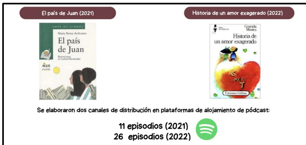
Figura 1: propuestas de pódcast inspiradas en dos obras de literatura para las infancias

estudiantes, sino para evaluar el propio desarrollo del proyecto. Estos fueron, para la fase del primer paso: estructura de la carta (encabezado, fórmula de apertura/cierre), punto de vista del personaje, contenido ficcional de la novela, normativa y, para la fase de realización del pódcast: uso expresivo de la voz, empleo de música, uso de efectos sonoros, uso de pausas y silencios, escritura de descripción de episodio. Finalmente, se destinó un espacio adicional para observaciones generales de los aspectos más logrados de cada episodio (ver Anexo).