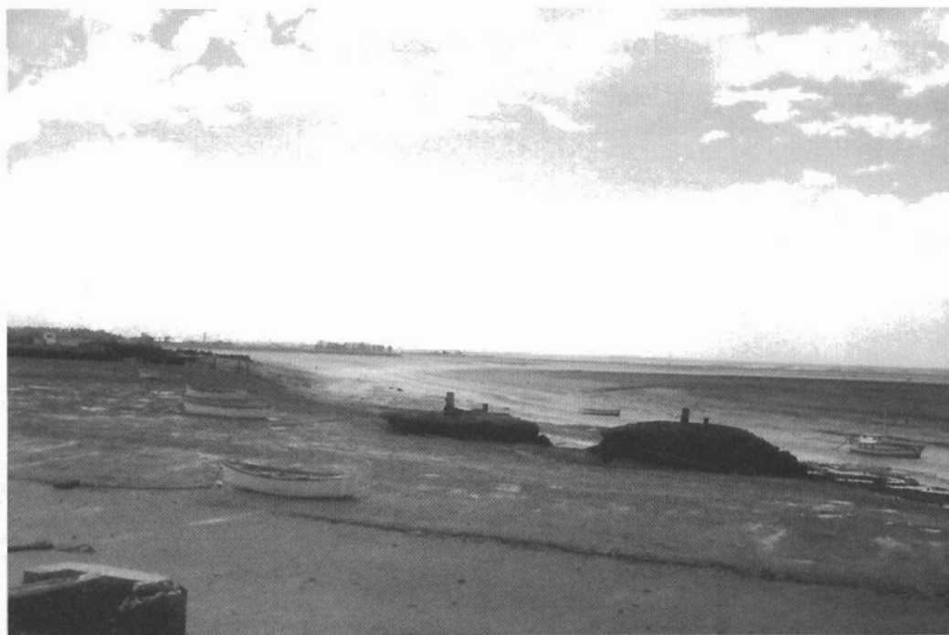
Paisaje costero desde el muelle del Club de Pesca y Náutica.

Todo el área conforma un ambiente de transición marino-continental, con una costa baja, salina, anegadiza, sinuosa, altamente inestable y en constante evolución debido al movimiento diario del flujo y refluo de la marea.