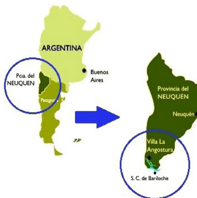
Figura N°1: Ubicación geográfica de la localidad de Villa la Angostura

La especulación de mercados transnacionales en pos del "desarrollo" turístico a lo largo y ancho del territorio de Villa la Angostura, no tardó en visibilizarse. En este contexto, comunidades mapuche han protagonizado diferentes reclamos territoriales, debido al avance del negocio inmobiliario sobre un territorio que consideran ancestral. La comunidad Paichil Antriao, es una de las comunidades mapuche que reside en la localidad de Villa La Angostura, ésta inició una notable visibilización pública a partir de reiterados reclamos por la