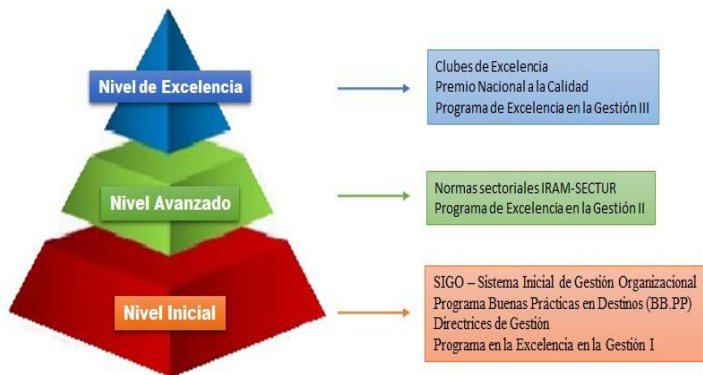
Figura 1: Sistema Argentino de Calidad Turística – pirámide evolutiva