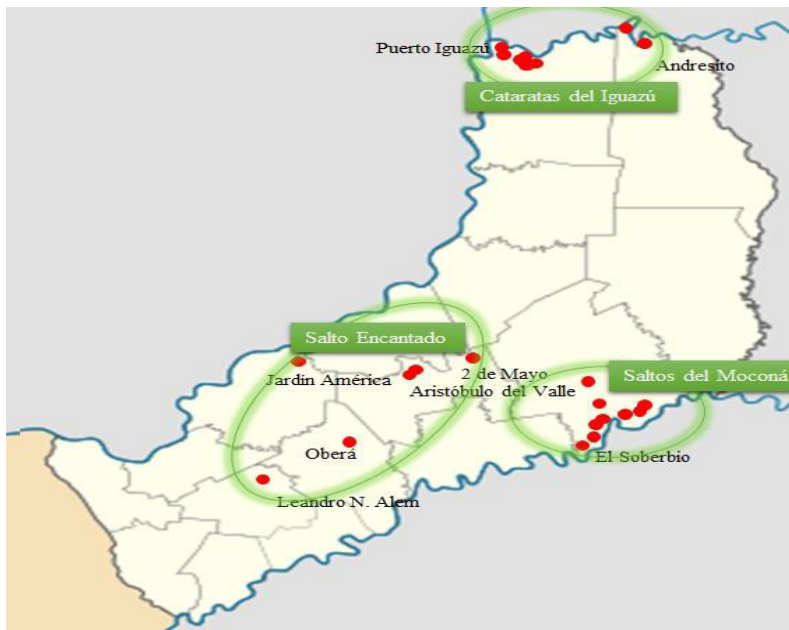
Figura 2: Distribución de lodges en Misiones y asociación con zonas de influencia de atractivos principales

Se sitúan en cercanías a 8 municipios, entre los que se hallan: Puerto Iguazú, El Soberbio, Aristóbulo del Valle, Andresito, Jardín América, Oberá, Leandro N. Alem y Dos de Mayo, actuando estos como municipios "de apoyo" o "de servicio", a los parajes, colonias y áreas naturales donde se ubican estos establecimientos.