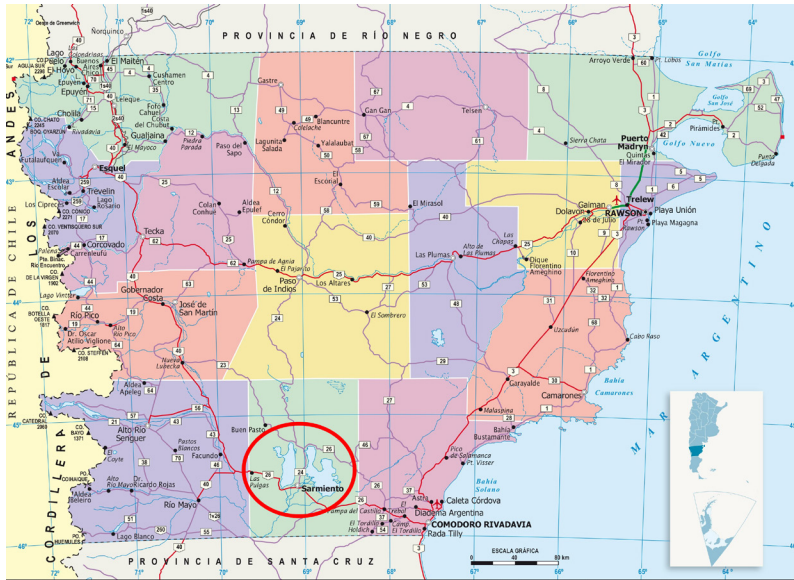
Figura 1: Mapa Provincia del Chubut.