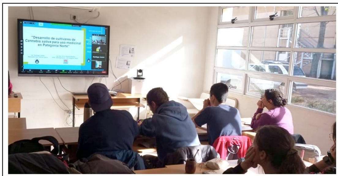
Figura 1. Actividad híbrida con profesionales de INTA B, INTA AV y ACCS, llevada a cabo en FaCA-UNCo.

Por otro lado, en cuanto a las dificultades técnicas de la conferencia, pudimos detectar que las actividades híbridas limitan la interacción con relación a la actividad presencial. Una dificultad técnica que tuvimos fue el sonido y la conectividad, lo que dejó a algunos alumnos excluidos de la oportunidad de hacer más preguntas. Esto nos plantea a nosotros como