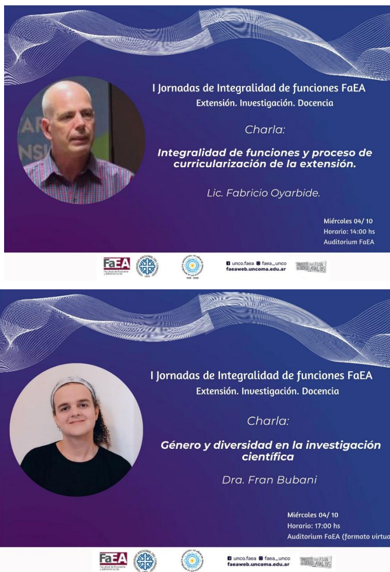
Figura 5: Facultad de Economía y Administración (UNCo). “Charlas en I Jornadas de Integralidad de funciones FAEA” (2023). [Folleto]