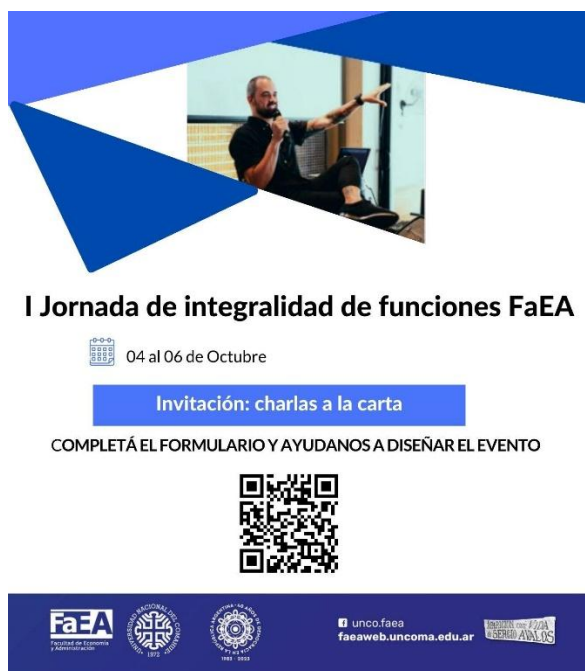
Figura 3: Facultad de Economía y Administración (UNCo). “Formulario para I Jornadas de Integralidad de funciones FAEA” (2023). [Folleto]

También invitamos a toda la comunidad a participar y a darnos más ideas con invitaciones de este tipo: