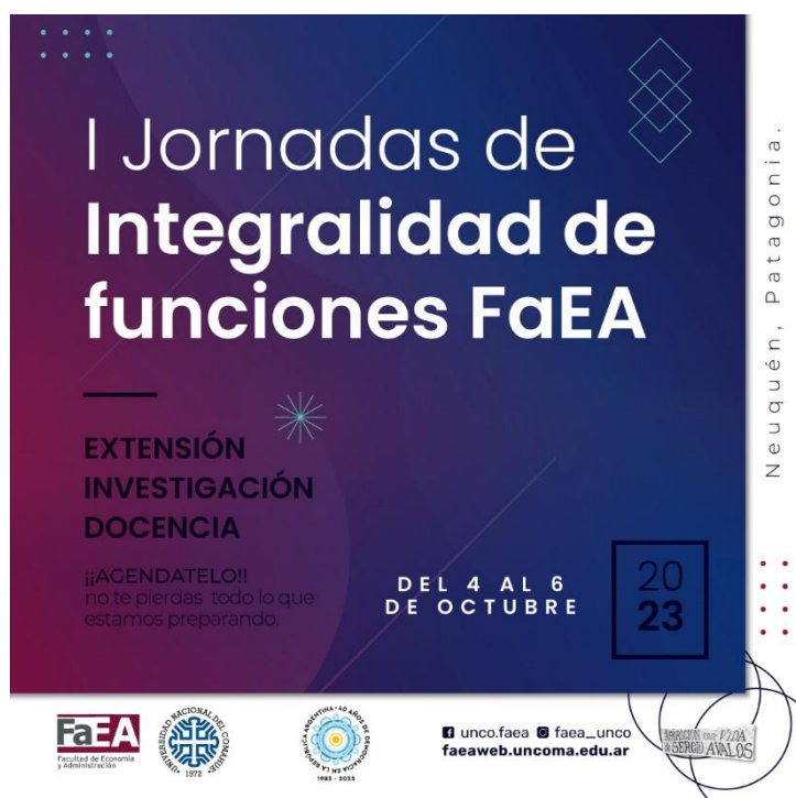
Figura 2: Facultad de Economía y Administración (UNCo). “I Jornadas de Integralidad de funciones FAEA” (2023). [Folleto]

Con el fin de generar expectativa y posicionar la idea, original para la zona Comahue, dimos amplia difusión previamente a través de la publicación en todos nuestros canales de piezas de este tipo: