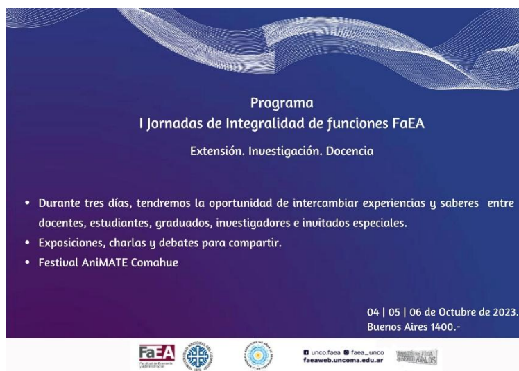
Figura 4: Facultad de Economía y Administración (UNCo). “Programa de I Jornadas de Integralidad de funciones FAEA” (2023). [Folleto]

Para la apertura de las jornadas, luego de la bienvenida por parte de las autoridades, se presentó un panel con reconocidos profesionales para conocer su opinión acerca de la integralidad de funciones desde distintas perspectivas en las que se desempeñan. Las ponencias se realizaron en modalidad híbrida, lo que nos permitió la participación de disertantes que llegaron de manera virtual.